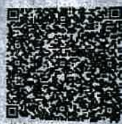
魏梦云年检二维码

本证书经检验合格，继续有效一年。 This certificate is valid for another year after this renewal.