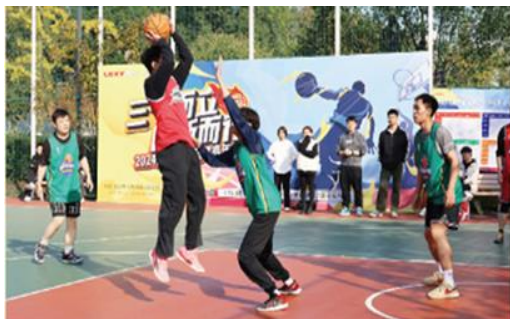
上图：篮球嘉年华比赛

社会公益等活动，让员工在工作的同时拥有强健的体魄。同时工会还积极开展民主沟通、爱国教育、读书活动以及各类趣味比赛等活动，不仅有效激发了员工的工作热情，也极大的丰富了员工的业余生活。