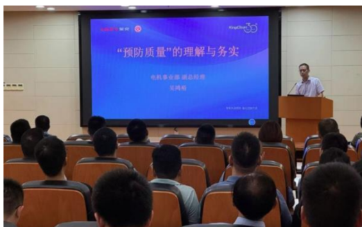
上图：2024年干部大讲堂