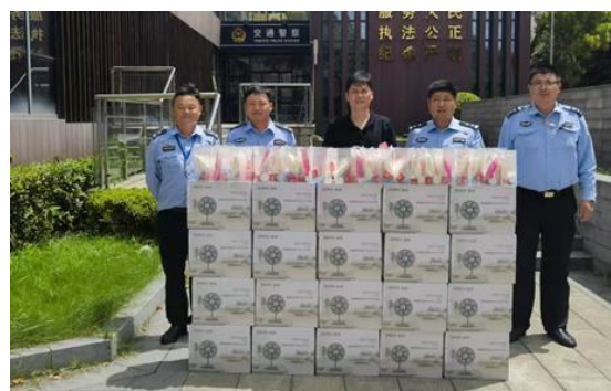
上图：捐赠空气调节扇