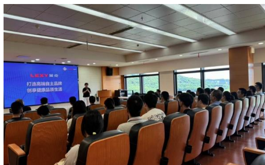
上图：新晋管理人员入职培训