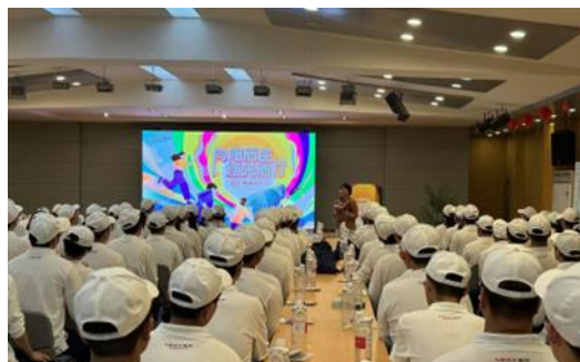
上图：2024阳光计划训练营