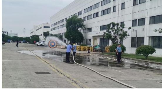
上图：公司举行消防演练