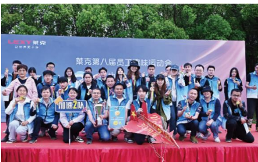
上图：第八届员工趣味运动会