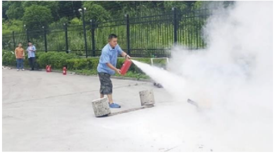
上图：公司举行消防演练