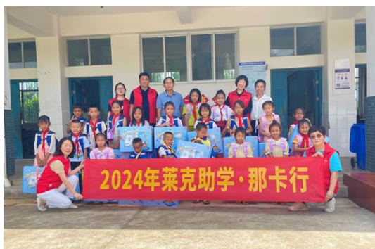
上图：2024年莱克云南那卡公益助学