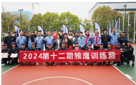
上图：第十二期班组长雏鹰魔训营

2024 年 2 人增评为高级工程师，使莱克副高人员达到 10 人以上；增评 15 名工业机器人持证员工；此外，公司内部自评职称晋升人员 350 人，晋级率达到 16.03%。