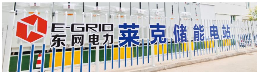
上图：莱克储能电站

公司始终坚持“节约各种资源、降低环境影响、推进持续改善、遵守法律公约、建设绿色地球、人人都有责任”的环境方针，在追求经济发展的同时，积极履行环境保护责任。公司投入上千万，建设光伏发电、能源管理信息平台，通过绿色工艺、环保管理、可回收管理、废气废水固废治理，实现节能降耗，有害物质零排放。2024年，公司积极响应国家绿色减排的号召，联合东网电力推出容量为4.2MW/9.03MWh储能项目，助力公司节能减排，构建了莱克清洁低碳、安全高效的能源建设体系，为碳达峰、碳中和贡献莱克力量。