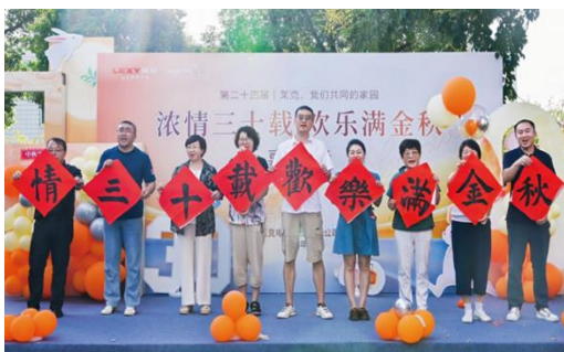
上图：2024年金秋游园会