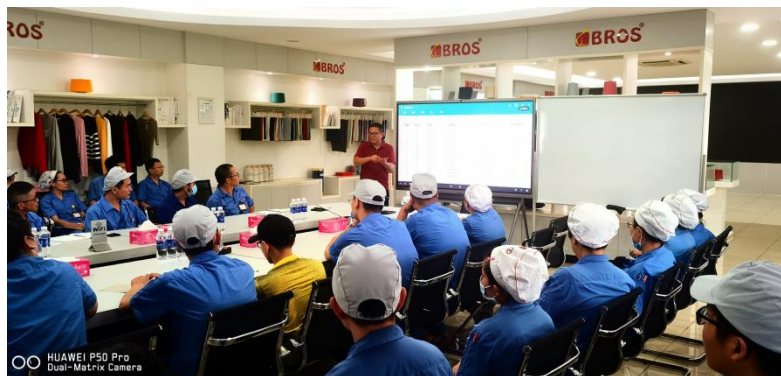
图 4 生产技术培训

2. 提供针对性培训： 百隆按不同需求建立了三个层次的培训网络，按不同专业设计阶梯式的人才培养机制；按不同内容选择多途径、多渠道培训方式，为每一个员工提供增值的职业发展机会。企业实施技能津贴等薪酬激励，技师们活跃生产一线，担任核心技术骨干。与浙江纺织服装学院十余年校企合作，通过畅通的职业发展通道与系统工匠培训机制，持续赋能员工成长，为企业高质量发展提供坚实人才保障。同时，公司鼓励员工自主学习和提升，支持员工参加外部培训和进修，为员工的职业发展提供广阔的空间。2024 年度，百隆旗下各主要子公司累计开展内训及外训共 115 次，培训费用合计 162366.01 元。子公司宁波海德深耕技能人才培养，累计培育“纺织染色工”高级工 30 余名、技师 10 余名及高级技师 6 名。