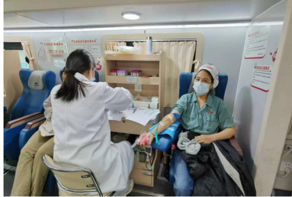
图 5 东方工厂组织无偿献血活动

2. 慈善捐赠活动： 本年度，百隆东方累计向宁波镇海慈善总会捐款 11 万元，涉及慈善冠名基金、万企兴万村慈善帮扶捐款等。子公司淮安新国纺织有限公司全体员工向淮安经济技术开发区慈善总会共计捐款 8830 元。开发区慈善总会一行领导来公司对淮安新国纺织全体员工对经开区的慈善事业的关心和积极参与表示感谢，并现场颁发捐赠证书。子公司曹县百隆举行“携手慈善·共建和谐”“慈心一日捐”，合计捐款 5 万元（员工捐款 6140 元，公司捐款 43860 元），担当百隆社会责任。