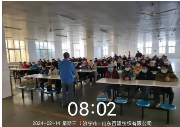
图 1 安全生产第一课学习

报安全生产情况，学习有关知识。把安全文化实实在在体现在职工的工作岗位上和生活学习的全过程。