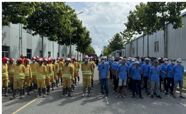
图 2 越南百隆年度消防演习