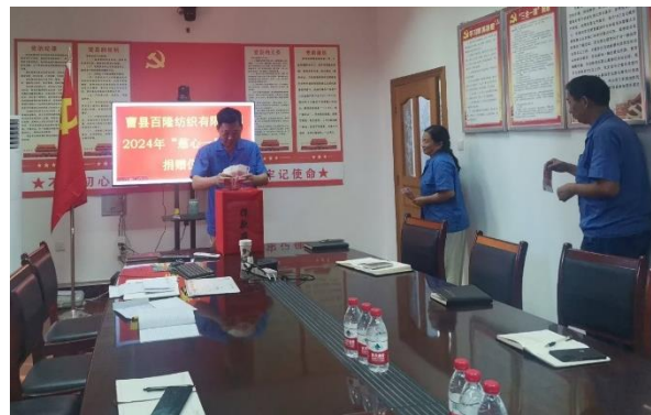
图 6 “慈心一日捐”捐赠活动

2. 慈善捐赠活动： 本年度，百隆东方累计向宁波镇海慈善总会捐款 11 万元，涉及慈善冠名基金、万企兴万村慈善帮扶捐款等。子公司淮安新国纺织有限公司全体员工向淮安经济技术开发区慈善总会共计捐款 8830 元。开发区慈善总会一行领导来公司对淮安新国纺织全体员工对经开区的慈善事业的关心和积极参与表示感谢，并现场颁发捐赠证书。子公司曹县百隆举行“携手慈善·共建和谐”“慈心一日捐”，合计捐款 5 万元（员工捐款 6140 元，公司捐款 43860 元），担当百隆社会责任。