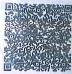
郑钢的年检二维码

本证书经检验合格，继续有效一年。 This certificate is valid for another year after this renewal.