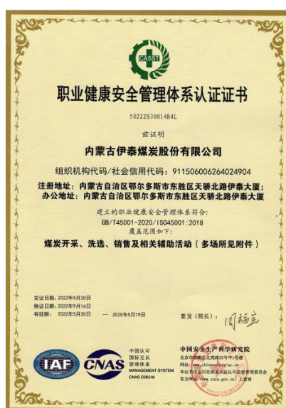
图：职业健康安全管理体系认证证书

2023年，公司确立并实现职业病危害防治年度目标，并配备具备专业资格的职业健康管理以保障员工身体健康。公司高度重视职业健康培训，对劳动者进行上岗前的职业卫生培训和在岗期间的定期职业卫生培训教育，督促劳动者遵守职业病防治的相关法律、法规、规章和操作规程。此外，公司密切关注员工职业健康，每年组织员工进行职业健康体检。报告期内，公司各产业板块均未出现新增职业病病例。