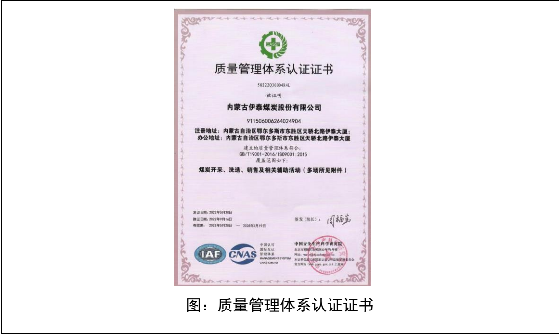
图：质量管理体系认证证书