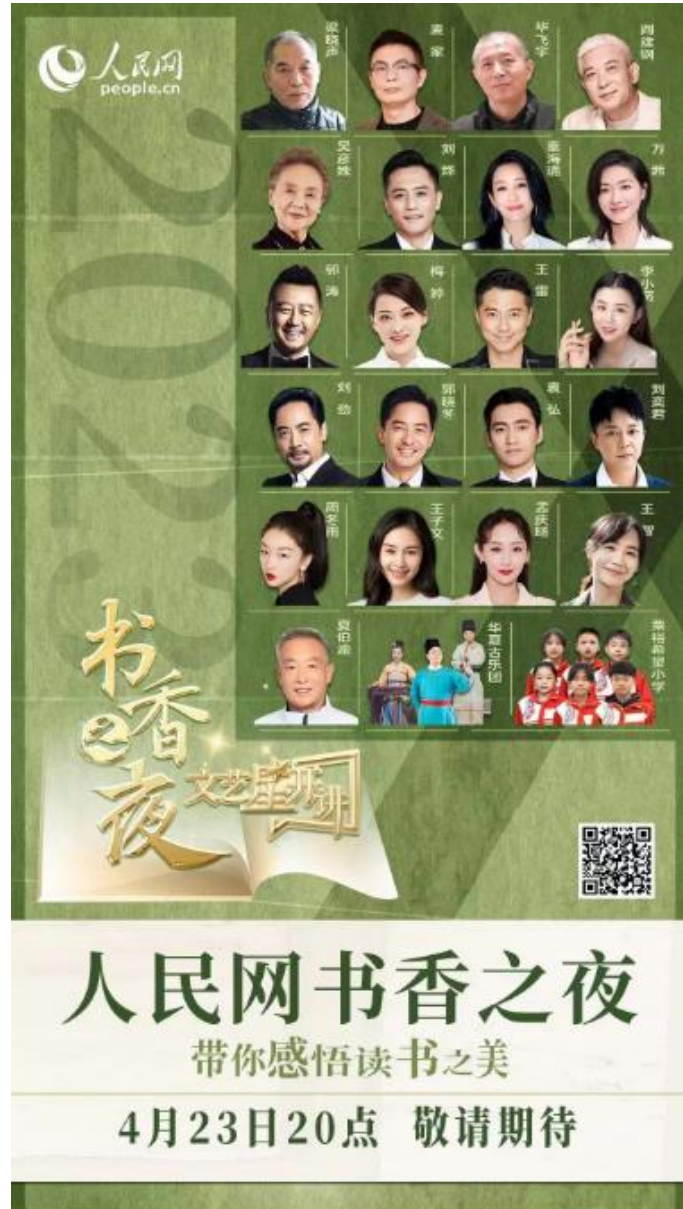
“人民网书香之夜”海报