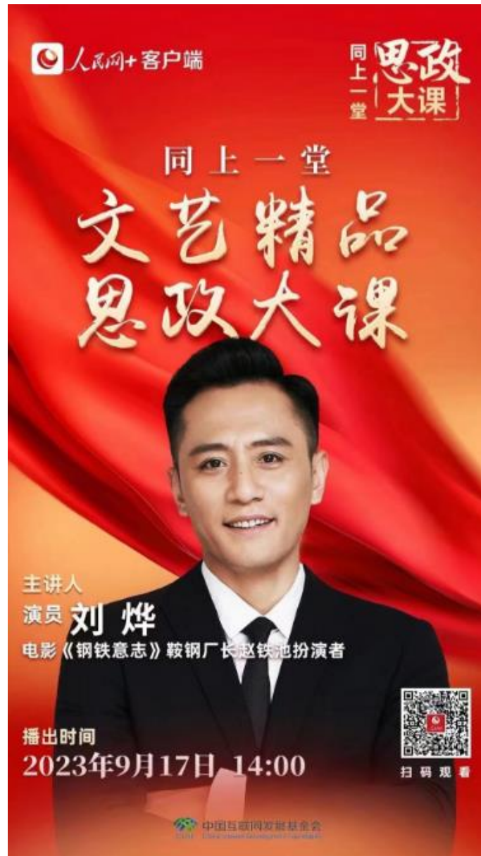
“同上一堂文艺精品思政大课”海报