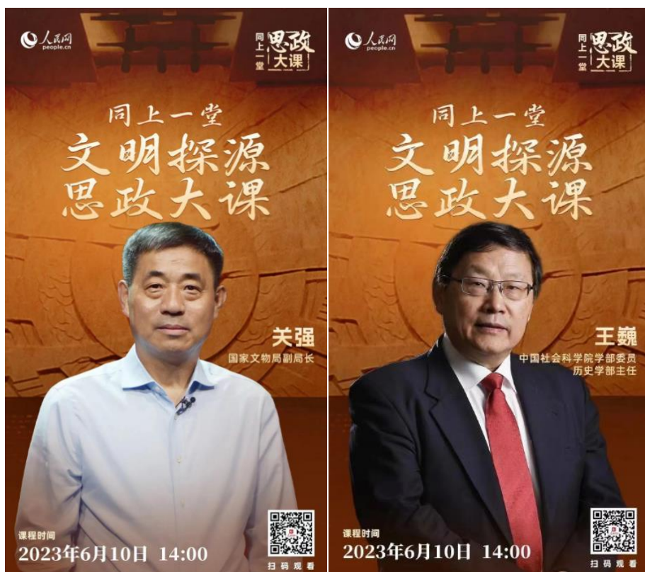
“同上一堂文明探源思政大课”海报

中华文明探源工程的故事。思政课在国家文物局官网同步播出，辽宁、福建等地组织学生观看，在各地师生中引发热烈反响。