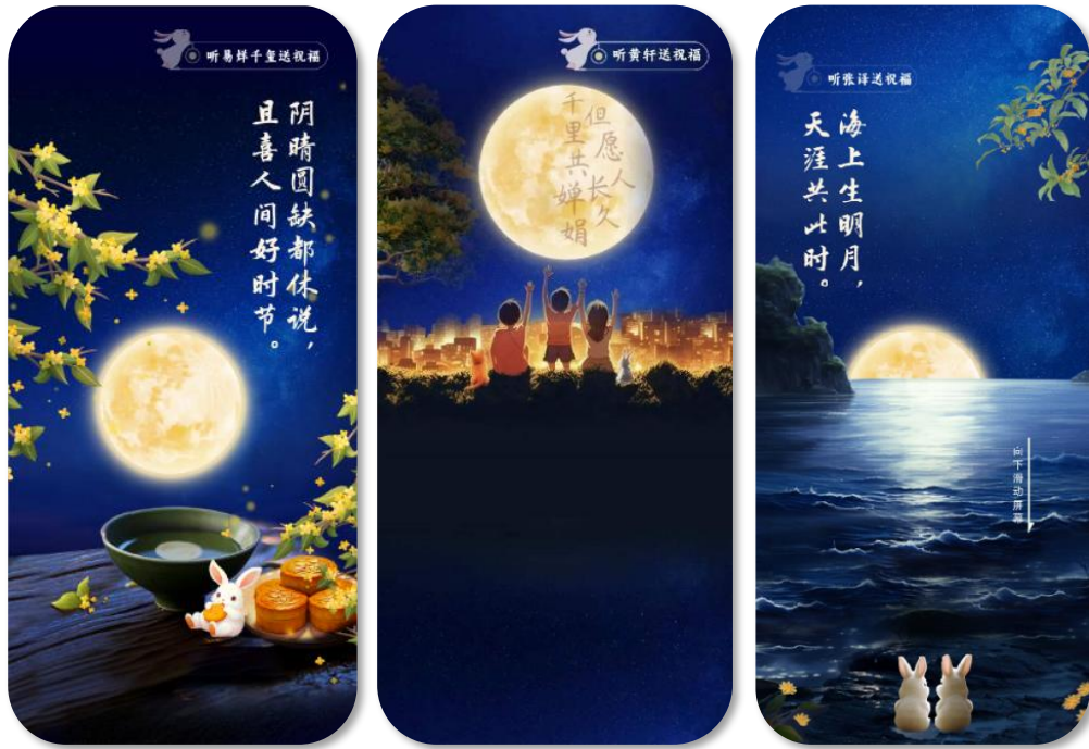
SVG 动态长图《一起 AI 中秋》

合的中秋画卷，并特别邀请张译、万茜、蒙曼、易烱千玺、杨紫、黄轩等多位有影响力的文艺工作者，倾情诵读中秋诗词中的经典名句，让广大网友通过创意满满的互动和清新优美的AI绘画，充分感受诗词之美、山河之美、文化之美。