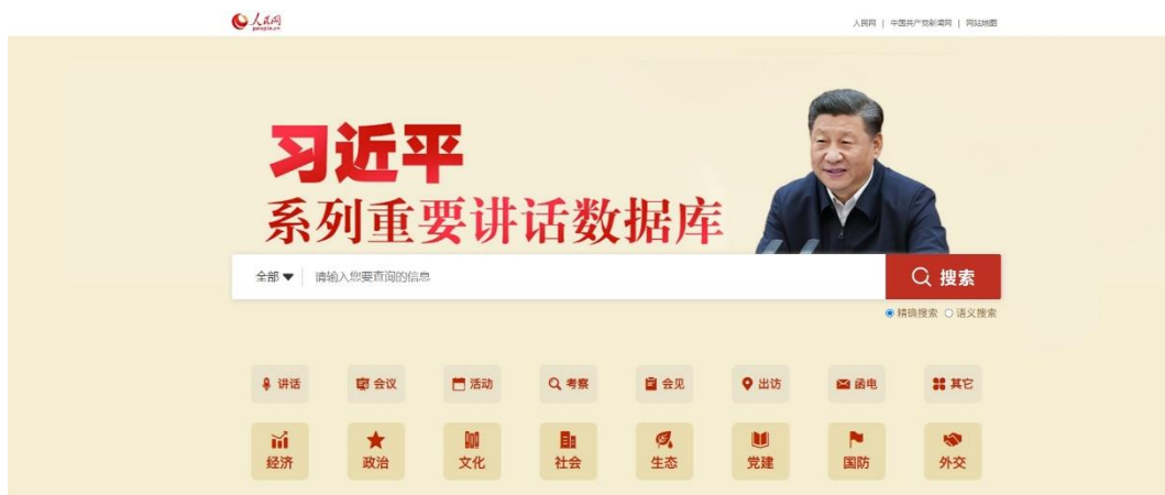
习近平系列重要讲话数据库

的“大哲理”，从地方实践切入看全局谋划。“习近平系列重要讲话数据库”应用前沿技术、丰富内容板块，共收录讲话、报道 1.3 万余篇，累计查询超 13 亿人次，已经成为推动习近平新时代中国特色社会主义思想学习宣传贯彻不断深入的重要平台、新形势下强化理论武装思想教育的创新工程。时政微纪录片《足迹·2022》以习近平总书记 2023 年新年贺词为魂、温暖足迹为线，播出 1 天在网络播放量超 2 亿次，电视覆盖超 5 亿用户，登上多个平台热搜榜首位。