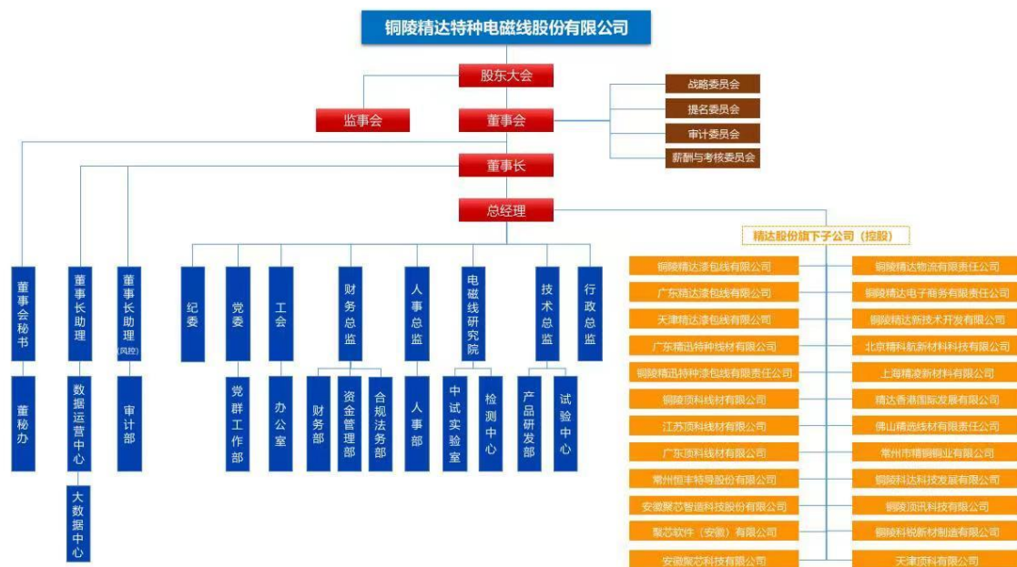
附件 1-2 截至 2023 年底铜陵精达特种电磁线股份有限公司组织架构图

注：广州特华指广州市特华投资管理有限公司；华安保险指华安财产保险股份有限公司-传统保险产品；员工持股计划指铜陵精达特种电磁线股份有限公司-2023 年员工持股计划