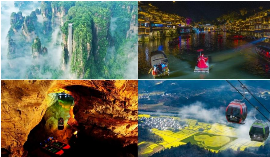
（左上：张家界百龙天梯；左下：黄龙洞游船及语音讲解服务； 右上：湖南凤凰古城沱江游船；右下：齐云山景区月华索道）

公司在齐云山景区提供月华索道、横江山水竹筏漂流和景区交通车等旅游运输服务，为游客提供多样化交通服务，丰富游客休闲游憩选择，极大地改善了当地旅游交通环境。