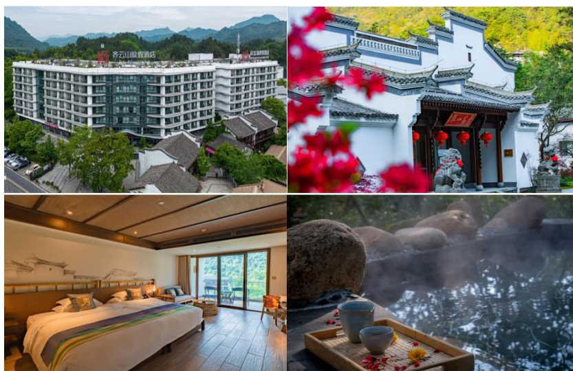
（左上、左下：齐云山祥富瑞酒店；右上、右下：黄山祥源云谷度假酒店）

黄山祥源云谷度假酒店前身为黄山云谷山庄，是 20 世纪末我国著名建筑师汪国瑜在建筑界“新乡土运动”的代表作之一。酒店地处黄山云谷索道旁，占地一万多平方米，号称“黄山深坑酒店”。酒店拥有各式房间 66 间，除住宿、餐饮、会务外，还提供温泉水疗、全天候一站式景点讲解、游客接送、商务套餐等服务。