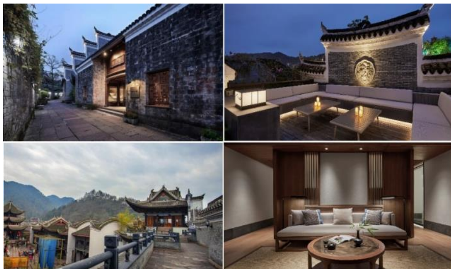
(熊公馆、万寿宫客栈酒店)