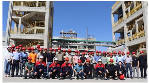
图 2：参观金鄂博氟化工项目现场