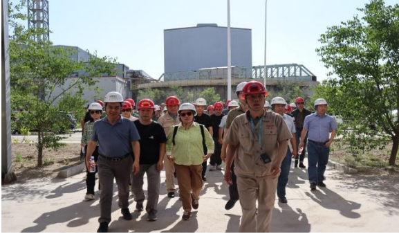
图 1：参观包钢金石萤石浮选回收生产线

2023 年 7 月 28 日至 7 月 31 日，本人在公司管理层的陪同下，考察了公司位于内蒙古包头市的控股子公司金鄂博氟化工、参股子公司包钢金石以及位于内蒙古乌兰察布市四子王旗的翔振矿业，对公司近两年布局的包钢“选化一体化”项目以及北方基地建设布局进行了现场调研考察。通过现场考察，本人对公司的生产经营、发展战略等有了更全面及深入的了解，本人就公司所面临的经济环境、行业发展趋势、公司发展规划、内控建设等情况与公司管理层进行了充分地交流，忠实地履行了独立董事职责。