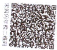
宋凤凤年检二维码