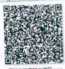
姜纯友的年检二维码.png

本证书经检验合格，继续有效一年。 This certificate is valid for another year after