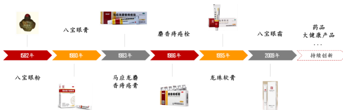
图：马应龙主要产品发展历程

马应龙创始于 1582 年，以眼药起家，拥有八宝名方。根据中医异病同治的原理以及马应龙八宝名方所具有的“清热解毒、活血化瘀、消肿止痛、祛腐生肌”的功效，20 世纪 80 年代以来，公司研发人员在八宝名方配伍的基础上，结合消费者的使用反馈，陆续研制推出了马应龙麝香痔疮膏、麝香痔疮栓、龙珠软膏和马应龙八宝眼霜等深受用户好评的产品，经过多年经营，逐步构建了肛肠细分市场优势地位。