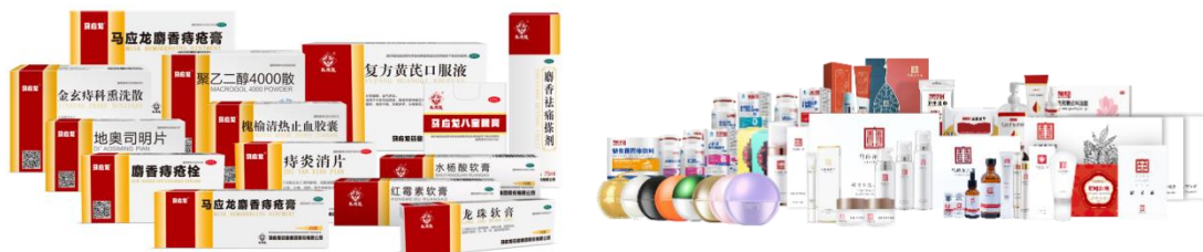
图：马应龙主要药品、大健康产品

固本、膳食补充等产品；消械产品包含肛肠术后护理、日用电子辅助产品、眼部器械护理、消毒杀菌类产品，已上市 SKU 超过 400 余个，在研产品 100 余个。