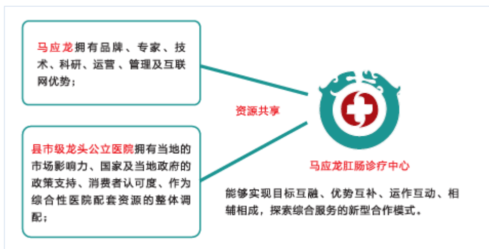
图：马应龙肛肠诊疗中心合作模式

医疗服务是公司立足肛肠健康核心领域、打造肛肠健康方案提供商、拓展肛肠全产业链的重要支点。公司秉承中医“大医精诚”的理念办医院，先后在武汉、北京、西安、大同等地建立马应龙肛肠连锁医院。目前已汇聚了一批由中国肛肠病治疗领域最具影响力的专家领衔组成的医生团队，拥有主任、副主任医师 40 多人，博士生导师 6 人，硕士生导师 15 人，为当下国内规模领先的肛肠专科连锁医院。同时，为充分发挥马应龙在肛肠领域的优势，在肛肠专科标准化建设、肛肠诊疗技术系统培训及规范、疑难病远程会诊等方面为县级医院提供全方位服务，公司先后与 70 余家县市级基层医疗机构共建了马应龙肛肠诊疗中心。马应龙肛肠连锁医院与众多国家级医药科研机构保持着良好合作，共同建立了北京大学马应龙博士后工作站、卫生部医药生物工程技术研究中心临床基地、国家中医药管理局肛肠病重点专科、军事医学科学院马应龙博士后工作站、中山大学达安基因肛肠疾病研究及检测中心、湖北省肛肠药物工程技术研究中心等研发机构，并先后承担省部级以上科研课题 15 项，着力将马应龙肛肠连锁医院打造成为集临床诊疗和科研于一体的专业化医院，使马应龙肛肠连锁医院专家团队始终保持与国际上最先进的肛肠诊疗技术接轨，使患者优先享受到最新科研成果的诊疗服务。马应龙健康云平台“小马医疗”作为公司为打造健康方案提供商，构建商业生态链而构建的专业化、垂直化的移动医疗平台，希望通过整合药品经营、诊疗技术、医疗服务、健康数据等各种资源，链接药企、医院、医疗信息化厂商、医疗器械和智能硬件厂商、体检机构、保险机构等行业资源，构建全链条、一体化的肛肠健康生态圈。