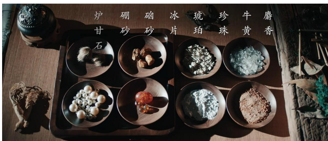
图：马应龙八宝名方

3、产品力优势。 马应龙持续经营四百余年，一方面得益于真勤理念的文化积淀，一方面得益于历久弥新的经典名方。马应龙名方包括麝香、牛黄、琥珀、珍珠、冰片、炉甘石、硼砂、硃砂等八味中药，又称八宝名方，具有清热解毒、活血消肿、去腐生肌的卓著功效。公司在八宝名方配伍的基础上，陆续研制推出了马应龙麝香痔疮膏、麝香痔疮栓、龙珠软膏和马应龙八宝眼霜等深受用户好评的产品。马应龙眼药制作技艺入选“国家非物质文化遗产名录”，马应龙治痔膏药获选工信部制造业单项冠军产品。