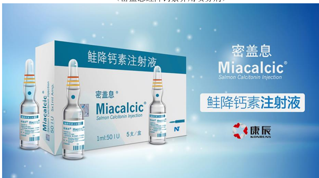
(密盖息鲑降钙素注射液)

2、公司始终坚持创新的核心战略，立足于未被满足的临床需求开展管线布局。目前，多项具有完全自主知识产权的药物正在有序地研发之中，主要如下：