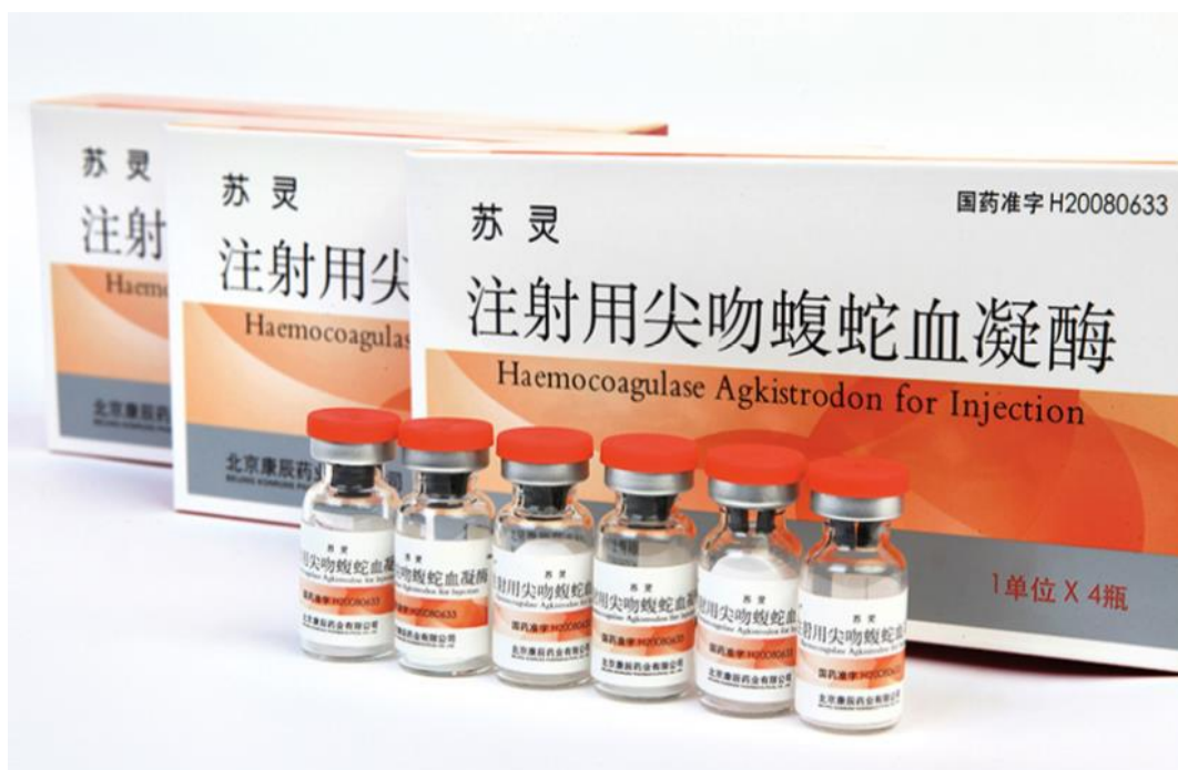
[国家一类新药尖吻蝮蛇血凝酶（商品名：“苏灵”）]