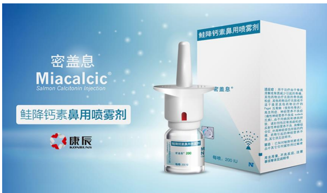
(密盖息鲑降钙素鼻用喷雾剂)