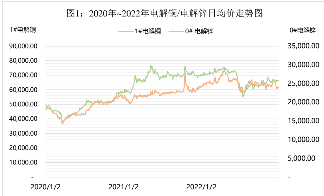
图1：2020年~2022年电解铜/电解锌日均价走势图