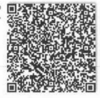
廖家河的年检二维码.png