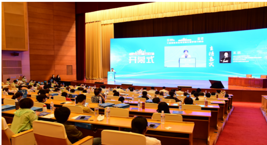
山东省脐血库承办 2022 年干细胞与再生医学研讨峰会

(四)齐鲁干细胞运营管理的山东省脐带血造血干细胞库是经国家卫生行政主管部门批准、验收合格的七家脐血库之一,也是山东省唯一合法的脐带血保存机构。截止 2022 年底,山东省脐血库储存脐带血 80 余万例,为全省 80 万个家庭提供健康保障。在查询移植方面,累计为国内外检索 HLA 相合脐血 3.9 万余次。其中,2022 年提供脐带血查询 7755 例。在临床应用方面,山东省脐血库累计为国内 28 个省份的 400 余家医院提供临床应用脐带血 13214 份,仅 2022 年就提供了 3314 份临床应用脐带血,同比增长 10.06%。出库脐带血干细胞各项复核检测指标均符合应用要求,细胞质量得到了应用机构和患者家属的高度认可。在科研创新方面,同全国 100 余家单位建立起科研合作关系,研究范围涉及肿瘤科、心内科、神经科、消化科、骨科、生殖科、新生儿科、风湿免疫科等科室,极大的推动了脐带血的应用研究领域,助力更多临床技术转化,造福广大患者。此外,脐带间充质干细胞、脐带血单个核细胞已完成三批次中国食品药品检定研究院认证,走在行业前列。