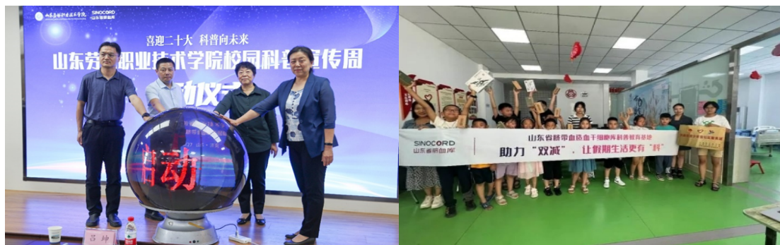
山东科学大讲堂—“健康科普进校园，护航青春助成长”系列活动 山东省脐带血造血干细胞库生命科普进校园系列活动

山东省脐血库的脐带血科普宣传和推广工作始终面向广大群众，深入基层。2022 年通过筹办“乐孕大讲堂”“校园科普宣传员招募”以及“生命科普进校园”等科普宣传活动，及微信公众号、抖音直播等形式，在全省范围内开展各类脐带血知识的科普宣教工作。并成立了山东省脐带血造血干细胞库健康教育基地，推动一系列优质的生物科学知识走进校园、走进社区。携手山东省医学会策划了一系列专题流行病防护科普直播，广受好评。