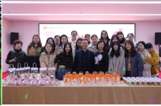
健康养老板块三八妇女节慰问