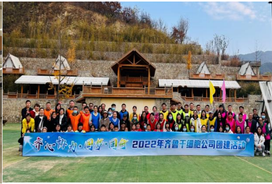
干细胞板块团建活动