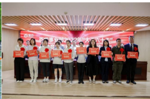
百货板块大干 60 天劳动竞赛表彰