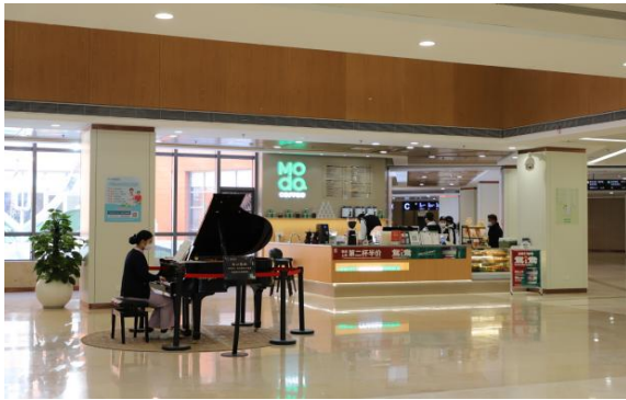
徐州新健康医院门诊音乐厅