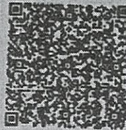
王许的年检二维码

本证书经检验合格，继续有效一年。 This certificate is valid for another year after this renewal.