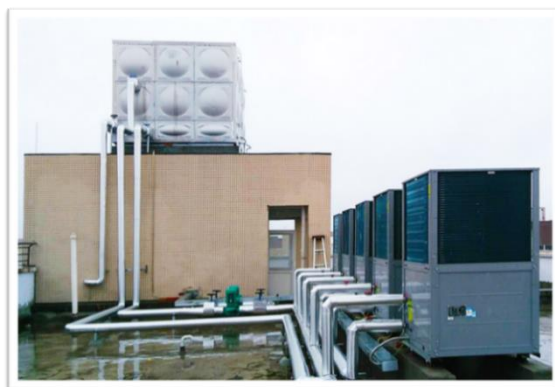
空气源热泵热源站

2022 年，子公司正蓝节能获得“节能舒适系统百强商”、汇贤优策获得“碳中和承诺示范单位”的荣誉称号。