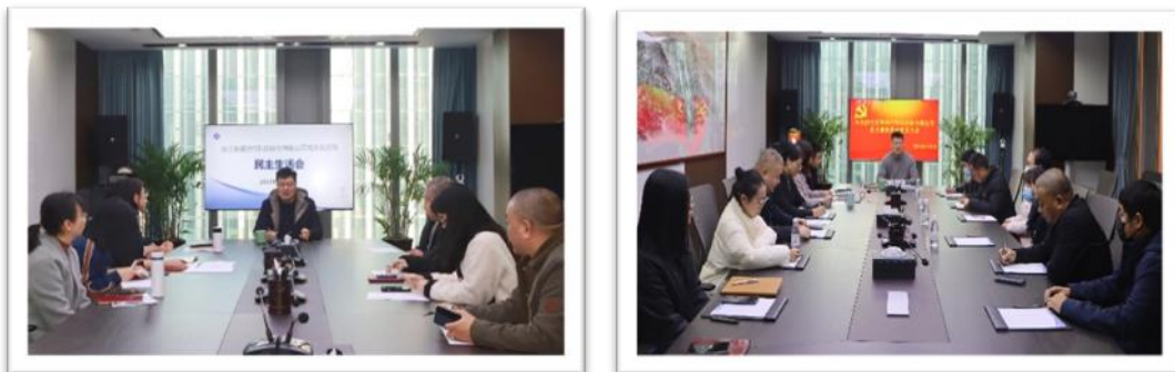
民主生活会、党员大会

三是深入开展理论学习。以开展月度主题党日活动及专题主题思想活动为载体，深入学习习近平新时代中国特色社会主义思想和习近平总书记重要指示批示精神；学习贯彻党的二十大会议精神等，教育引导广大党员增强“四个意识”、坚定“四个自信”、做到“两个维护”。