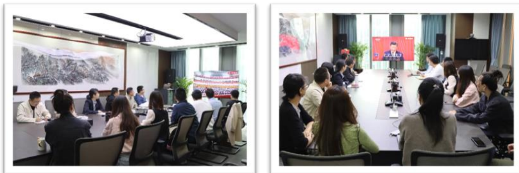
学习党的二十大精神

三是深入开展理论学习。以开展月度主题党日活动及专题主题思想活动为载体，深入学习习近平新时代中国特色社会主义思想和习近平总书记重要指示批示精神；学习贯彻党的二十大会议精神等，教育引导广大党员增强“四个意识”、坚定“四个自信”、做到“两个维护”。