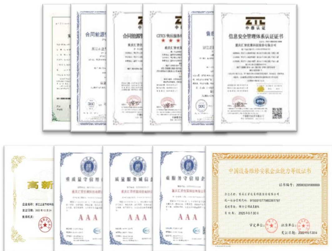
部分资质、荣誉、专利证书

证书”、“重质量守信用企业（AAA）”等证书。公司以高质量的产品、优质的服务对客户负责，不断提高管理和服务质量。