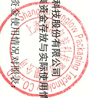
附表 1: 募集资金使用情况对照表