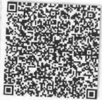
张丽芳前年检二维码.png

转入协会盖章 Stamp of the transfer-in Institute of CPAs 2019年11月14日 / /