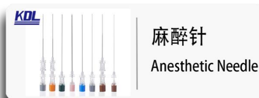
麻醉针 Anesthetic Needle