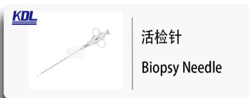
活检针 Biopsy Needle