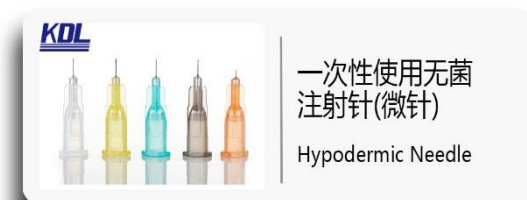
一次性使用无菌 注射针(微针) Hypodermic Needle