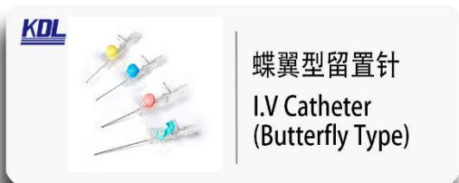
蝶翼型留置针 I.V Catheter (Butterfly Type)