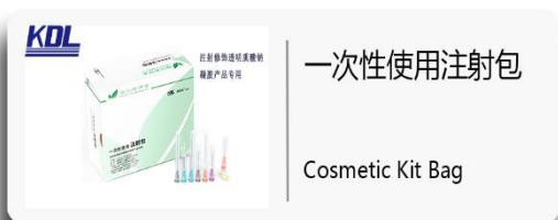
一次性使用注射包 Cosmetic Kit Bag