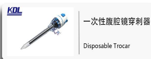
一次性腹腔镜穿刺器 Disposable Trocar