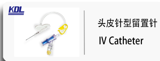
头皮针型留置针 IV Catheter