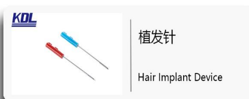
植发针 Hair Implant Device