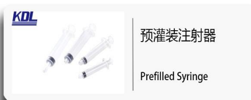
预灌装注射器 Prefilled Syringe