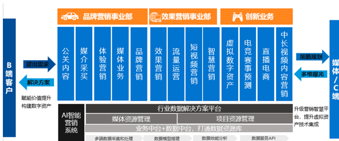
公司数字营销业务模式图

发行人的主营业务为数字营销，主要服务于汽车、互联网、游戏、金融、旅游、快速消费品等行业客户，提供一体化数字营销解决方案。发行人业务已覆盖公关营销、媒介采买、体验营销、品牌营销、效果营销、流量运营、短视频营销、智慧营销、虚拟数字资产、电竞赛事预测、直播电商、中长视频内容营销、直播电商等数字营销全链条。