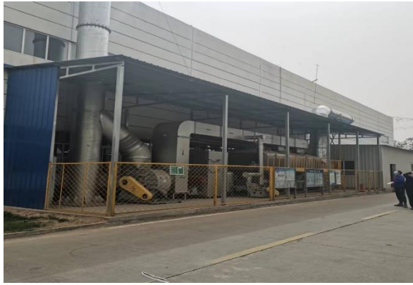
图 6 沈阳云瓦达沙夫计划投资 200 万元，建设 G08 生产线清洗废水处理站，项目采用低温蒸发和膜过滤处理工艺，实现清洗废水循环使用不外排，实现节水和减少污染物排放的目的。

图 7 凌云股份本部、阔丹凌云、河北亚大汽车完成物流门视频门禁监控系统安装并与监管平台联网，有效落实了地方重污染天气报警期间对重型运输车辆的管控。