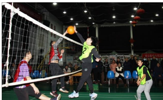
图 18 凌云股份公司举办气排球、羽毛球比赛

公司开展庆祝建党 100 周年系列主题活动。举办了表彰先进大会暨职工文艺汇演，颁发“光荣在党 50 年”纪念章，重温入党誓词，举办“奋斗百年路、启航新征程”“把一切献给党”主题图片展、系列主题征文、演讲比赛、读书会等活动，开展“周五之夜”红色电影展映、“凌云杯”足球联赛、气排球、羽毛球比赛、健步走等喜闻乐见的文化体育活动，传承优秀文化，展示良好精神面貌。