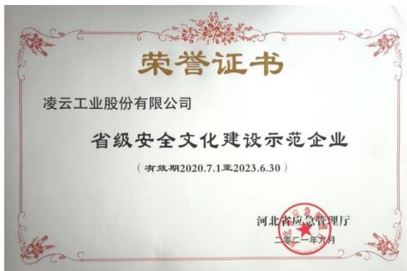
图 13 2021 年省级安全文化建设示范企业

面对安全生产新形势,公司深入学习贯彻习近平总书记关于安全生产的重要论述,持续压紧压实安全生产责任,扎实推进安全生产专项整治三年行动,体系化加强安全生产管理工作,不断夯实安全生产管理基础。2021年,公司获得“省级安全文化建设示范企业”和“河北省职业健康企业”荣誉称号。