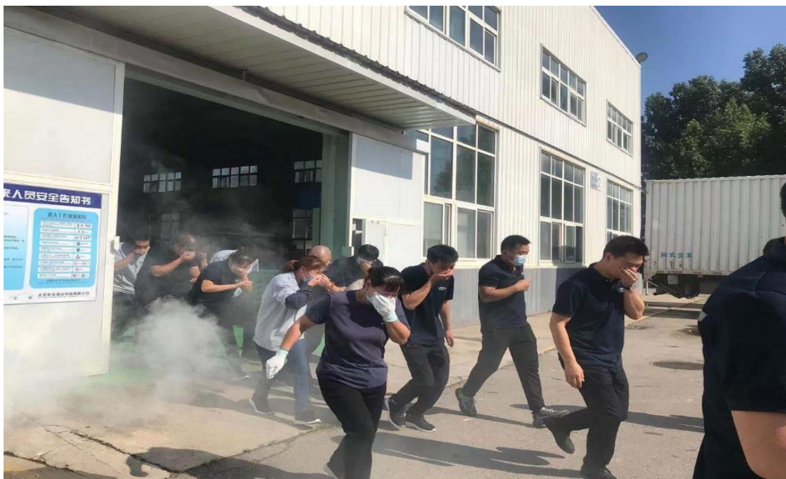
图 15 应急演练

公司修订完成了安全生产事故应急预案，健全了综合应急预案、专项应急预案和现场处置方案体系，实现了总部应急预案与分子公司应急预案的有机衔接，并完成了地方应急管理部门备案工作。同时各单位积极开展应急演练活动，全年累计开展应急演练 120 场次，近 6000 人次参与。