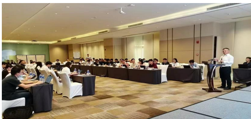
图 3 上海投资者交流活动

为增进与投资者交流沟通，公司组织多项交流活动，一是邀请主流财经媒体、分析师进行一对多访谈活动，深度解读公司战略规划；二是作为首批推介公司，参加 2021 投资者集中交流活动，向 170 家参会机构主题展示公司高质量发展态势；三是举办凌云股份上海投资者交流活动，向 70 家主流机构展示公司发展潜力、发展后劲、科技