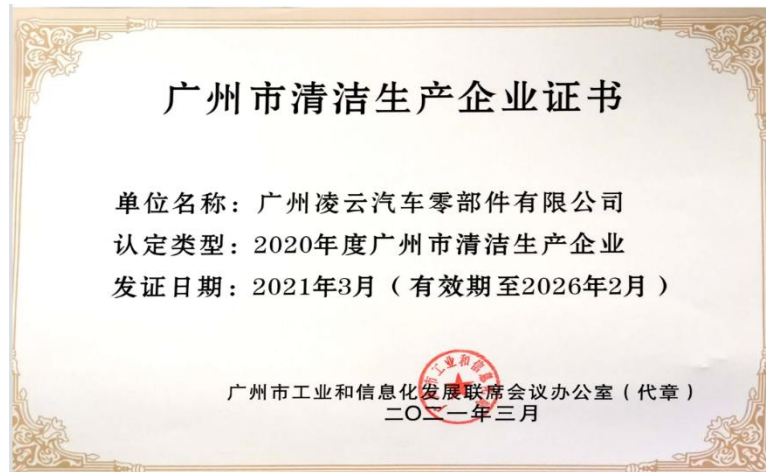
图 12 广州凌云清洁生产审核证书