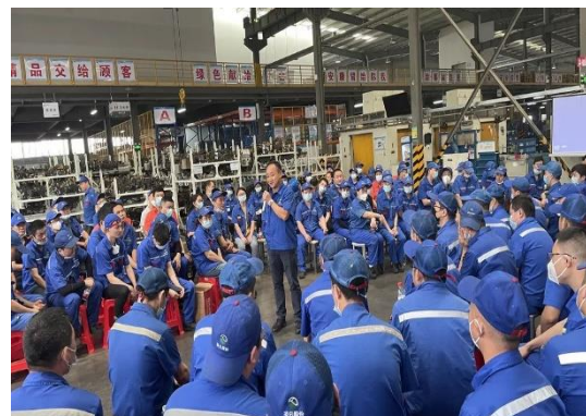
图 14 安全培训