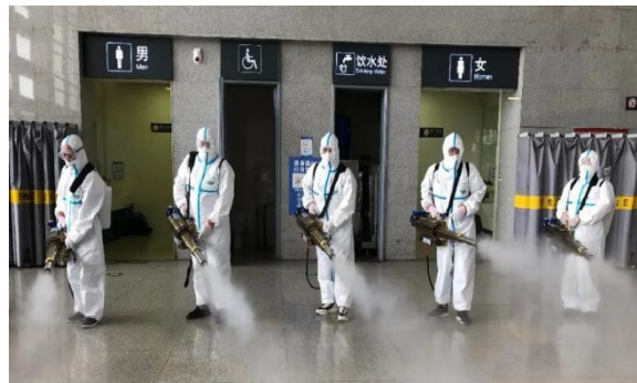
图 17 凌云胶管公司在涿州东站开展消杀

凌云亚大管道公司、凌云驱动轴涿州公司、凌云胶管公司组织党员志愿者服务队走进涿州火车站、部分中小学校和幼儿园，开展环境卫生大消杀，以实际行动把好事办好，把实事做实，在新学期为广大师生撑起了一把安全健康保护伞。