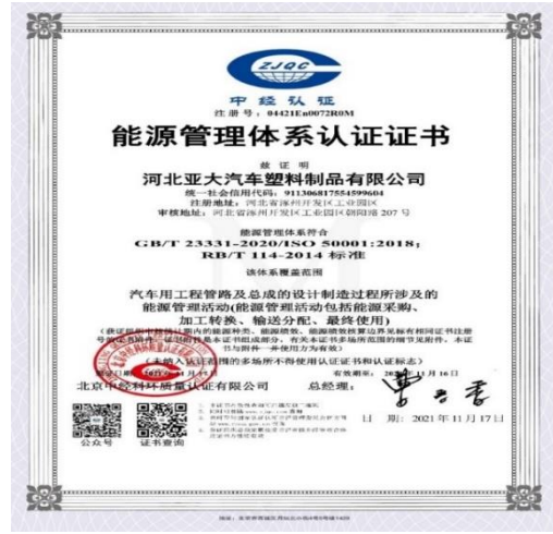
图 9 河北亚大汽车建立能源管理体系获得体系证书