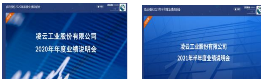
图 2 年度报告业绩说明会

公司披露年度报告、半年度报告后，及时召开业绩说明会，提前征集投资者关注问题，会同相关职能部门专题研究，提出回复口径。公司董事长、总经理出席年度业绩说明会，直接与投资者交流。邀请独立董事、保荐代表人作为嘉宾进行现场互动。通过上证路演中心文字互动平台和可视化年报手段提升交流效果。