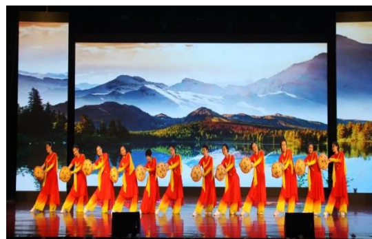
图 19 职工文艺汇演