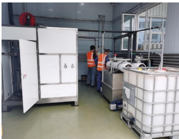
图5 阔丹凌云投资 137 万元，将原有三台 VOC 治理设施进行提标改造，原设施为活性炭吸附+光氧催化现改为活性炭吸附+催化燃烧处理，提高了 VOC 废气治理效果，达到了河北省重污染天气应急响应绩效评级 A 级标准，进一步减少重污染天气停限产带来的影响。