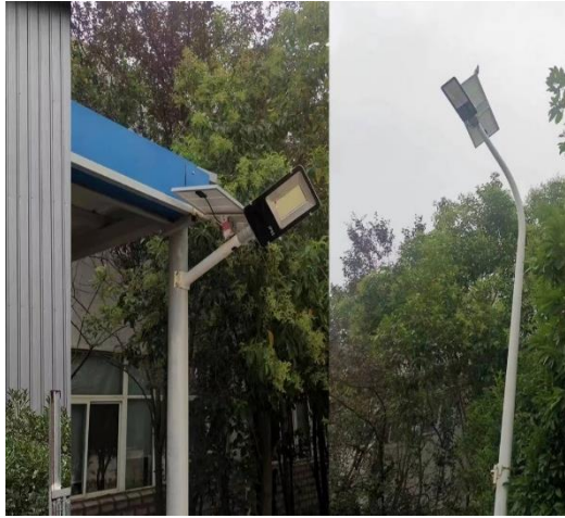
图 8 中南厂区路灯改造为太阳能灯