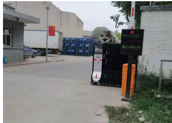
图 7 凌云股份本部、阔丹凌云、河北亚大汽车完成物流门视频门禁监控系统安装并与监管平台联网，有效落实了地方重污染天气报警期间对重型运输车辆的管控。