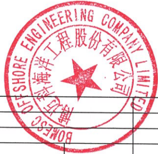
募集资金使用情况对照表