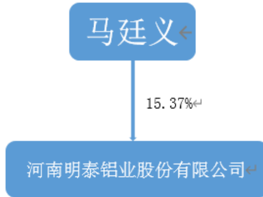
附件 1-1 截至 2022 年 3 月底河南明泰铝业股份有限公司股权结构图