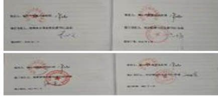
2021 年年度安全目标责任书签订情况

依据“一岗双责”及“管业务必须管安全、管生产必须管安全、谁主管谁负责”的要求，福田汽车建立了两级安全生产责任管理机制，依规健全并落实全员安全生产责任制，公司/事业部（工厂）层层签订安全目标责任书 15000 余份，定期评价目标责任落实情况。