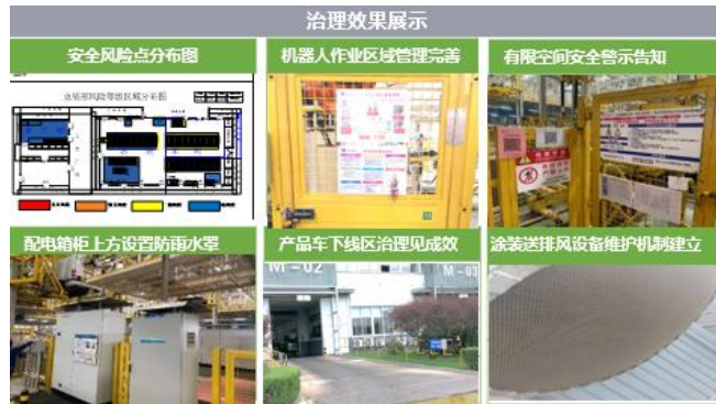
安全风险管控治理效果

公司制定了《安全风险分级管控管理制度》，标准化安全风险分级管理流程，规范安全风险点划分，风险因素辨识评价，风险管控措施等管理标准，集团下发专项工作计划，推动各单位以生产作业部为单元，逐部门组织安全风险分级管控工作，2021年全年累计辨识安全风险点4452个。同时，落实各安全风险点风险管控措施，同时依据分级管控原则，明确各级风险安全责任人定期审核规范，建立安全风险分级审核机制。