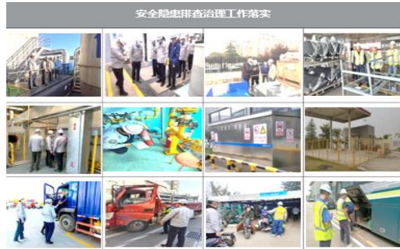
安全隐患排查治理工作落实

查治理、用电及配电箱柜专项排查治理、新能源车生产安全评审治理等，专项评审治理工作的有效开展，基本保证了二级以上风险点全部受控。