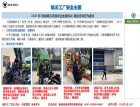
安全微课堂及精品安全培训课程

2021 年，福田汽车继续健全安全教育培训管理机制，建立月度安全培训效果审查机制，进一步规范安全培训管理，提升安全教育培训效果；2021 年完成 6400 人新员工三级安全教育培训与考核，4378 人通过岗位安全技能考核；建立 9 类重点岗位人员“1+4”、班组“1+1”安全培训机制，重点岗位 3459 人，班组长及管理层 847 人完成安全再培训，一定程度上提升了作业人员安全技能水平及安全意识。