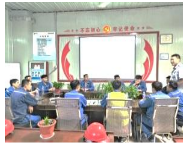
新员工安全培训考核