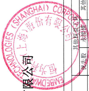
2021年度公司所有者权益变动表 (金额单位为人民币元)