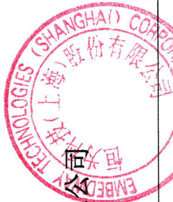
2021年度合并所有者权益变动表（续） （金额单位为人民币元）