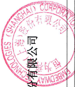
2021年度公司所有者权益变动表 (金额单位为人民币元)