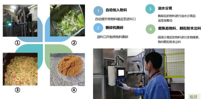
湿垃圾无害化处理-设备运转流程

收利用率，与第三方合作建立湿垃圾生化处理系统，不仅节约了每年的处置费用，还为项目提供了免费的绿化用肥。