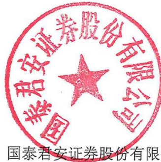
国泰君安证券股份有限公司