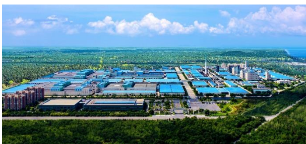
康辉新材料（营口）产业园区图

依托全产业链优势和专业研发团队，康辉新材料攻克各项技术难关。从细分市场看，康辉新材料已成为国内最大的中高端 MLCC 离型基膜生产企业，国内市场占有率超过 65%，打破了国外垄断，有效填补了市场空白，并出口日韩等海外高端市场，公司的高平滑 MLCC 离型基膜已实现量产，超平滑 MLCC 离型基膜工艺定型，并完成了日韩企业对样品的认证，开始小批量生产，超高平滑 MLCC 离型基膜通过日韩企业技术验证，正在加速推进中，以期快速实现量产。同时康辉新材料也是国内唯一、全球第二家能够在线生产 12 纳米涂硅离型叠片式锂电池保护膜的企业。