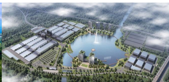
康辉新材料（汾湖）产业园规划图

在营口基地基础上，康辉新材料正加快规划在江苏苏州的汾湖基地和昆山基地的整体设计与项目建设工作，待上述两大基地完全投产后，等于再造两个升级版的康辉新材料，公司也将成为全球最大的功能性薄膜、功能性塑料和生物可降解新材料生产基地。针对国内绿色环保消费与先进制造功能性薄膜市场的快速放量增长，康辉新材料与德国布鲁克纳公司最新签订了 24 条最先进的功能性薄膜生产线，年产达 80 多万吨，将分别在汾湖与昆山基地建设；并与巴马格惠通及苏美达聚友签订了 90 万吨生物可降解塑料生产装置，将分别在长兴岛和营口基地建设，同时加强在 PBT/PET/PBAT 塑料等改性方面的研发生产，并开始试水 4 条改性研发试验线，进一步强化在母粒、基膜和型材基础上的材料改性研制能力。