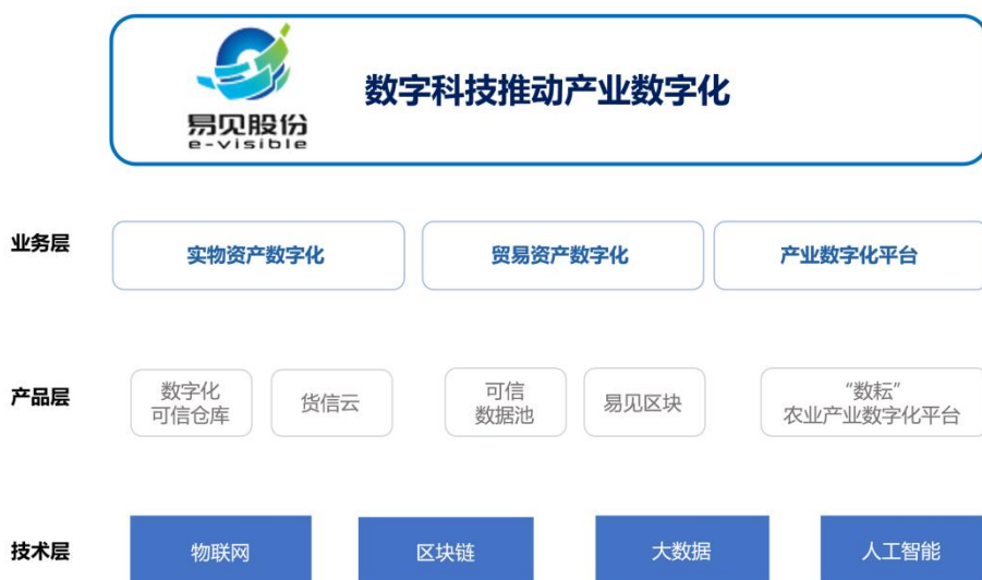
公司科技板块的整体架构图