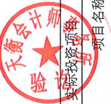
前次募集资金投资项目实现效益情况对照表