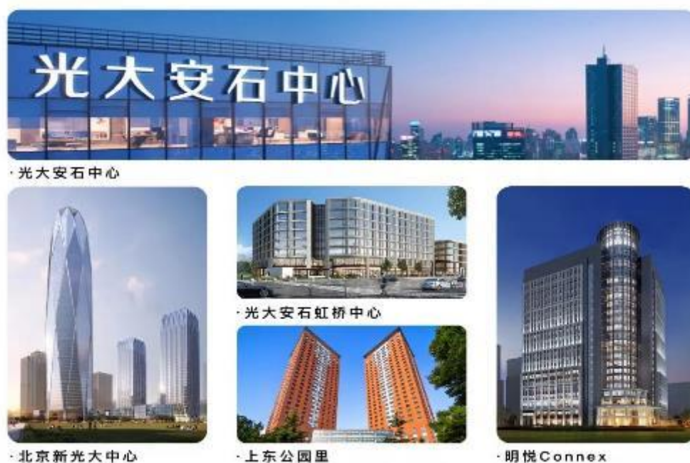
光大安石部分资管项目

市场投资等多渠道产品投资。截至 2020 年 12 月末，通过各种机会型、增值型基金，光大安石累计管理规模超过 1260 亿人民币，已成功退出超过 790 亿元投资、119 个项目。光大安石旗下自有商业品牌大融城，始终坚持以精细化管理及运营为核心，因地制宜地呈现各具特色的商业空间，致力于为不同年龄层的消费者带来新颖时尚、年轻潮流的购物体验。目前光大安石已在全国 10 个城市布局 19 座大融城，总管理规模超 200 万平方米，打造了 Art Park 大融城、IMIX PARK 大融城、大融城生活馆、文旅商业中心及大融汇五大产品条线。