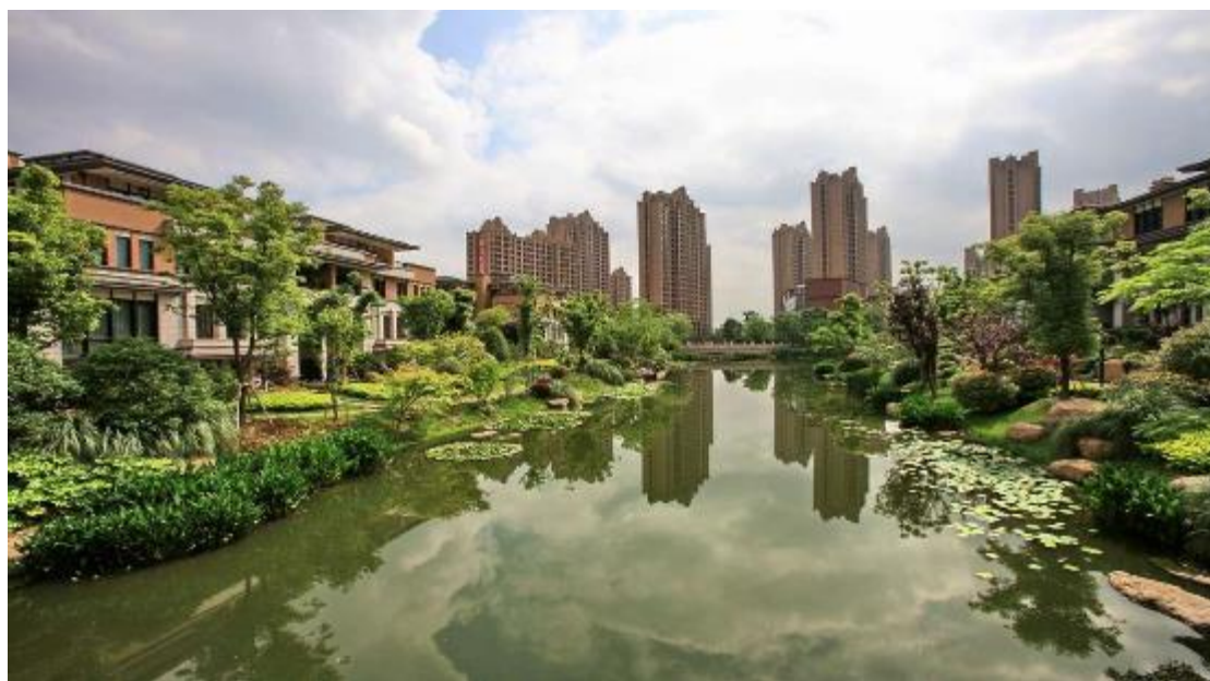
嘉宝·紫提湾低密度住宅

公司地产开发品牌在长三角具有较好的口碑和较强的竞争力，年开发能力超 100 万平方米。近年来，公司打造了一系列优质楼盘，多次获得“上海市优秀住宅金奖”、上海市节能省地型“四高”优秀小区、上海市建设工程“白玉兰奖”、上海市“园林杯优质工程金奖”等荣誉称号。