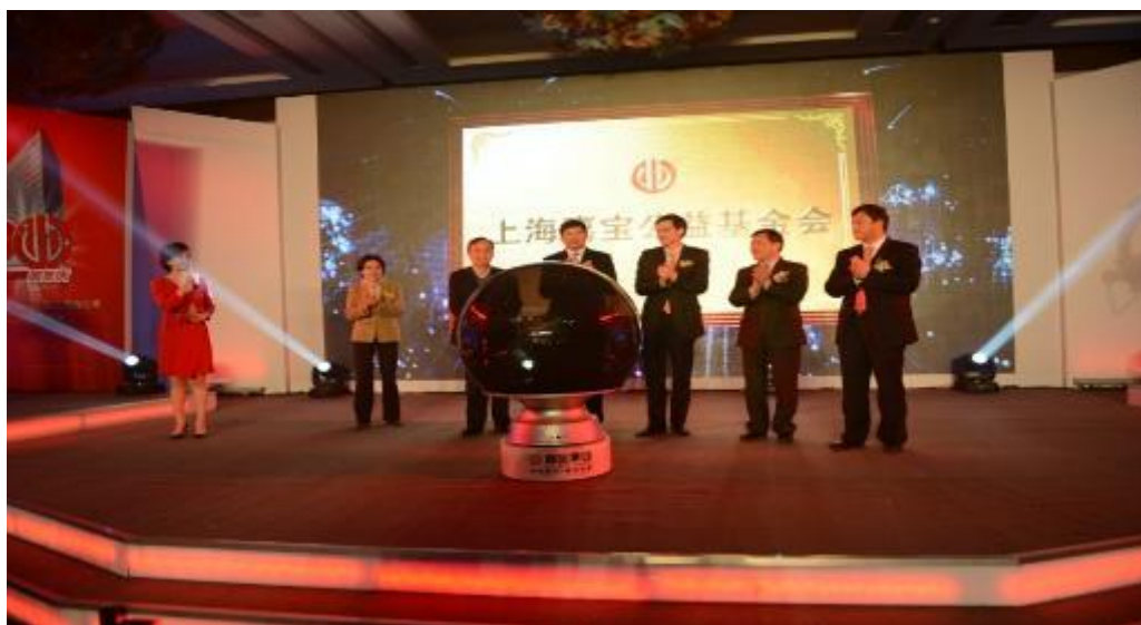
2012年上海嘉宝公益基金会成立仪式

多年来，在不断促进企业经济持续发展的同时，光大嘉宝也一直热心和关注区域及社会公益事业，积极搭建公益事业平台、助推公益事业发展，勇于承担企业的社会责任和义务，共享社会发展成果。2012年，公司上市20周年之际，由公司捐赠4000万元成立的上海嘉宝公益基金会（以下简称“公益基金会”）正式运作。公益基金会立足奖励见义勇为者、教育卫生英才，资助社区助老扶老、文化发展。成立以来，相继开展了“嘉宝杯”最美医生评选活动，嘉定区“十佳”青年教师、“十佳”班主任，“嘉宝杯爱心助老天使”奖等主题公益活动，逐步培育起具有嘉宝特色的公益活动品牌。上海嘉宝公益基金会不仅推动了公司公益事业上了一个新台阶，也标志着公司公益事业正式走上了一条制度化、常态化的道路。