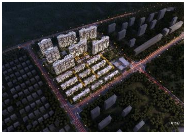
嘉宝·梦之晴项目效果图

嘉宝·梦之晴华庭项目位于上海市嘉定区安亭镇硕望路 188 弄。项目规划总用地面积 6.05 万平方米，总建筑面积 15.8 万平方米，地上计容总建筑面积 10.89 万平方米。