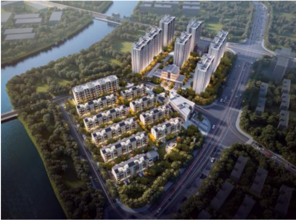
嘉宝·梦之春项目效果图

嘉宝·梦之春项目位于上海市嘉定区新成路街道，项目规划总用地面积 2.8 万 m^2 ，总建筑面积 8.2 万 m^2 ，计容面积 5.05 万 m^2 。项目以“品质地产、品位生活”的开发理念，依托完善的区域整体规划，良好的周边资源，旨在建设成为一个生态、宜居、特色鲜明的风情化示范社区。项目主要以高层和多层高品质住宅为主要业态，结合合理的社区配套等，整体具有新城市主义的建筑之美，并对区域发展有着重要促进作用。