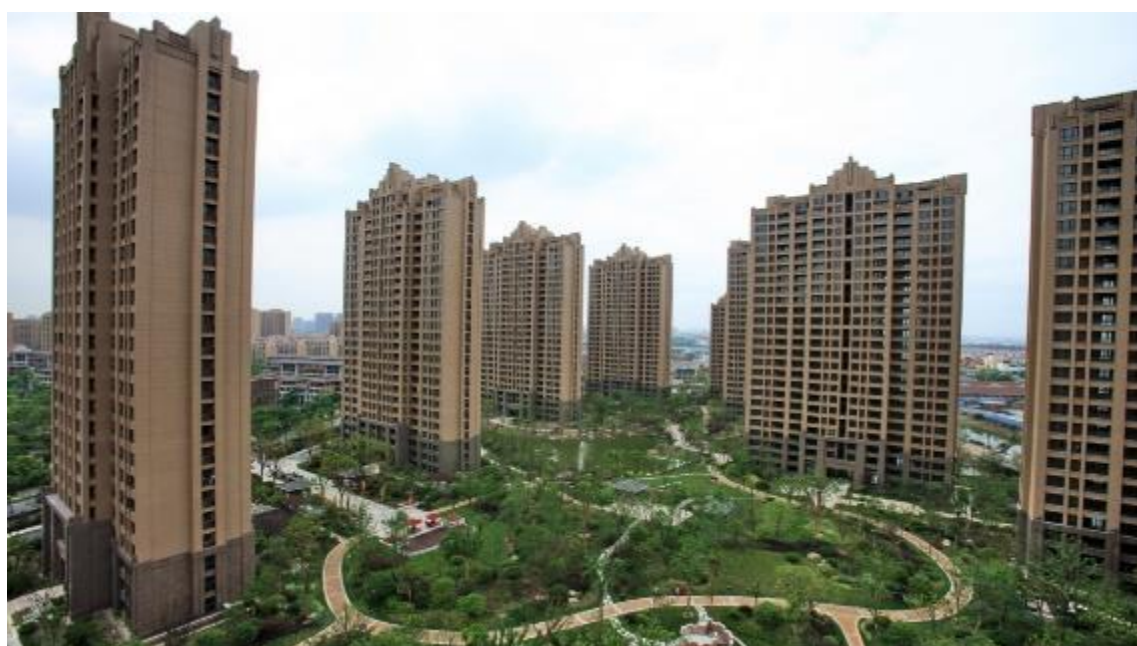
嘉宝·紫提湾高层区住宅