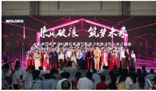
国庆中秋文艺晚会