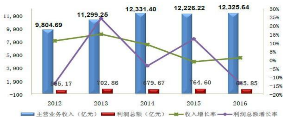
近五年重机行业收入利润增长情况

近年来，受世界经济低迷及国内经济结构调整和经济下行压力的叠加影响，重型机械行业下游产业产能过剩和市场需求不足的问题日益凸显，全行业增长乏力的迹象开始显现，行业增速持续下滑。受此影响，重型机械行业面临市场疲软、供大于求、竞争激烈、价格下滑的情况，企业经营压力不断加大。2016年，重型机械行业全年主营业务收入12325.64亿元，同比增长1.50%；利润总额645.85亿元，同比下降13.36%；利润率5.24%，比去年同期下降0.9%。