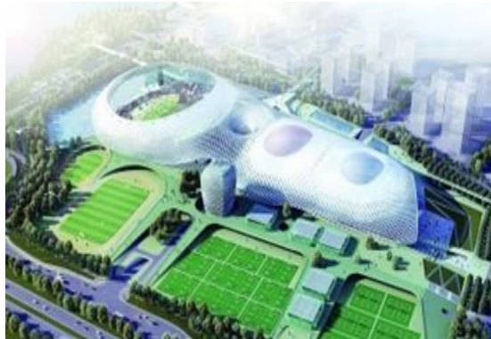
深圳湾体育中心 荣誉：国家优质工程奖