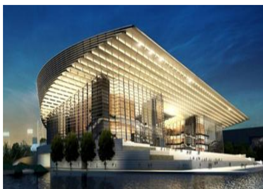
天津大剧院 荣誉：鲁班奖

公司践行“精于技术，工于品质”的产品理念，以卓越的质量、先进的技术、合适的成本、合理的工期为客户打造精品工程。精品工程不仅为客户带来直观的效益，同时也为公司高端品牌的树立奠定了基础，实现了客户利益和公司利益的共赢。经过十多年的发展，公司先后承建了“鸟巢”、上海环球金融中心等一系列让世界铭记的品牌工程。2013年，公司继续发挥技术领先优势和品牌优势，建设了多个高品质项目，为客户提供了业内最优质的服务，公司共获得鲁班奖5项、詹天佑奖1项，国家优质工程金质奖2项，中国钢结构金奖12项。