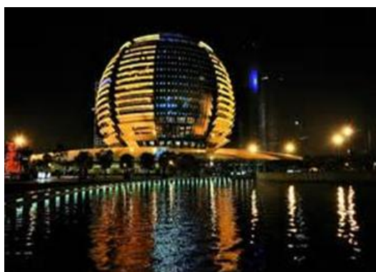
杭州国际会议中心 荣誉：国家优质工程奖