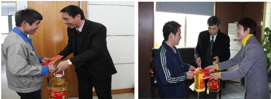
“幸福工程”慰问活动

2013年集团领导组织开展了“精工人爱心基金”内部慈善活动，帮助精工大家庭中因重大疾病、意外灾害、贫困和子女助学导致的家庭困难，进一步提高员工的凝聚力并让员工分享企业发展的成果。2013年累计向80位困难员工捐赠了爱心慰问金近37万余元。