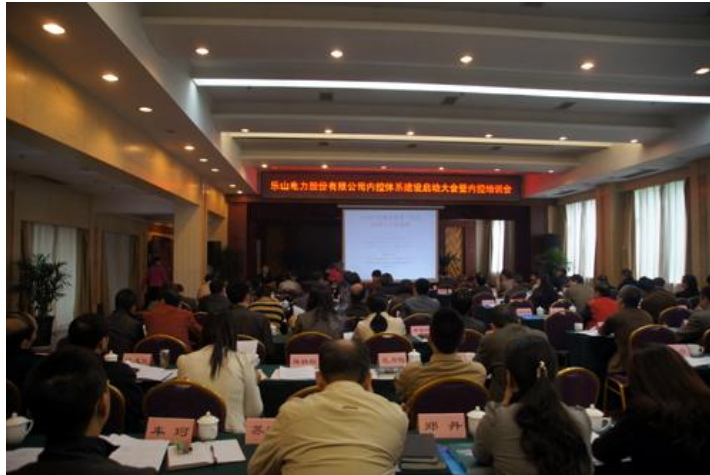
图四：召开内控体系建设启动大会暨内控培训会