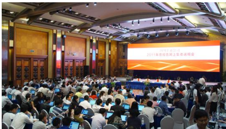
图七：参加网上投资者交流活动现场