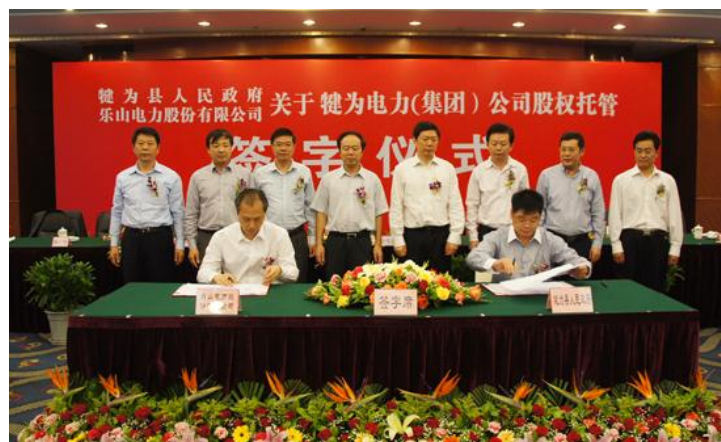
图五：犍为县政府与公司签署犍为电力集团股权托管协议

为深入贯彻落实四川省电力公司与乐山市政府签订了《关于加快推进乐山两化互动、促进乐山更快更好发展的战略合作协议》，公司积极与市、县两级政府沟通协商，分别于2012年4月和8月与犍为和峨边县政府签订了犍为电力集团股份有限公司和峨边大渡河电力股份有限公司的《股权委托管理协议书》。公司在签订《协议书》后认真履行托管职责，积极主动与两托管公司对接。公司以托管为契机，坚持以市场和效益为中心，以防范企业经营风险和市场风险为重点，加大经营管理力度，加强规范管理，理顺委托管理权责关系，促进了公司与托管公司的共同发展。