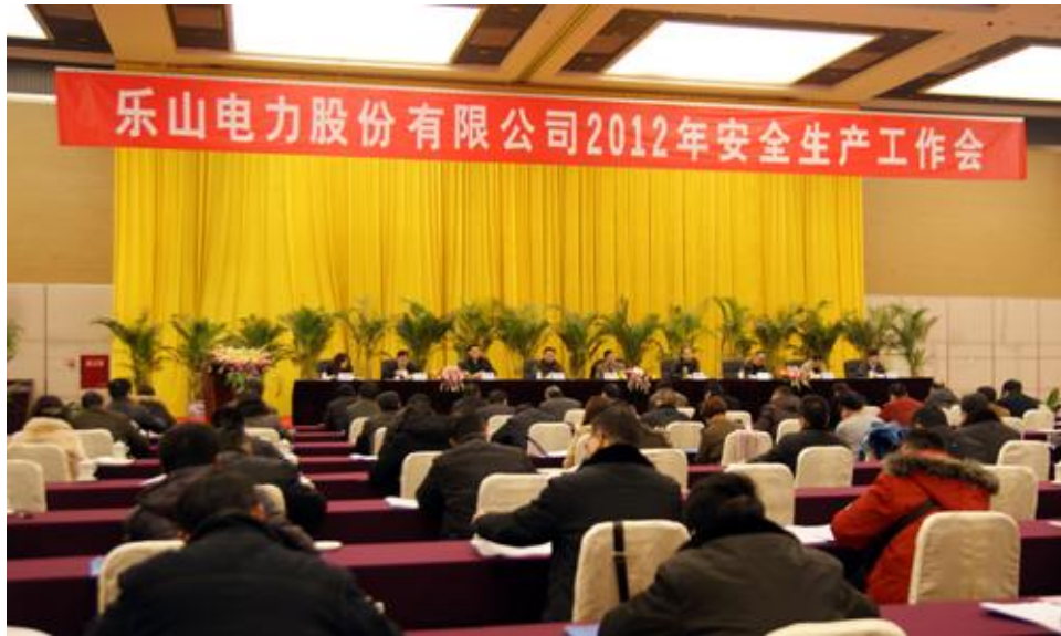
图二：全部署公司 2012 年安全工作