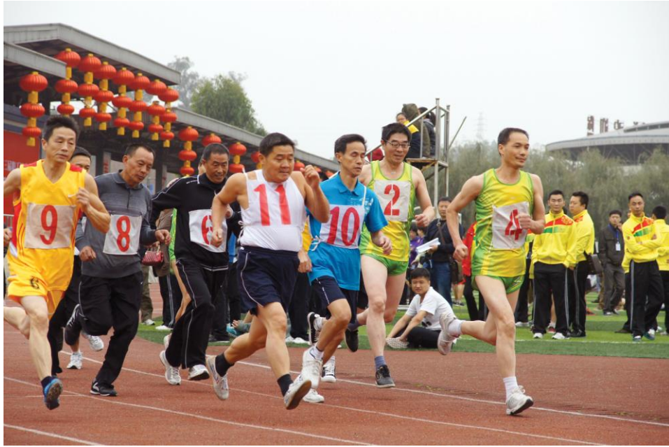
图十一：第三届职工运动会