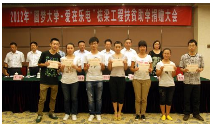
图九：公司扶贫助学捐赠大会

公司连续两届参与由上海证券报开展的“珍珠焕彩”慈善公益活动。目前，首个“上海证券报爱心珍珠班”已在宁夏回族自治区首府银川育才中学成功开班，50名宁夏籍贫困学生受到捐助帮扶。