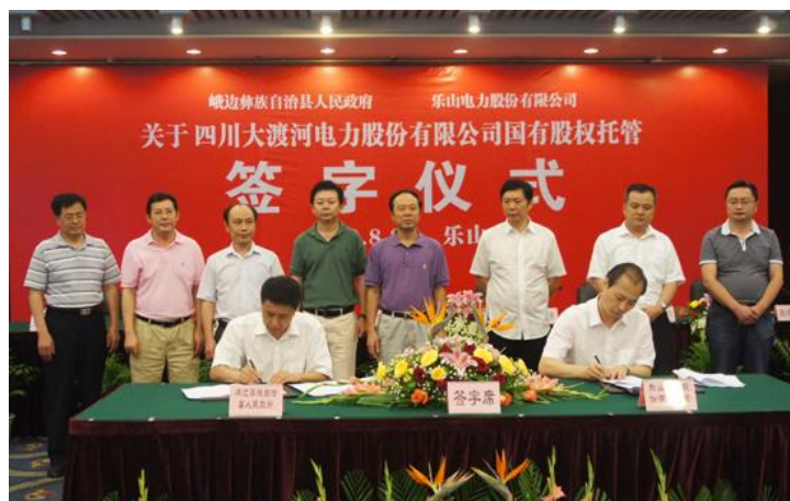
图六：峨边彝族自治县人民政府与公司签署峨边大电股权托管协议