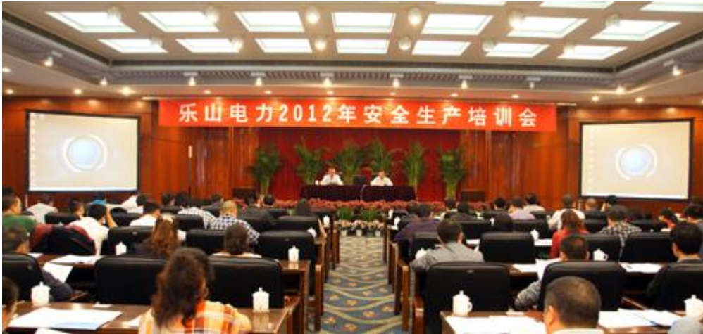
图三：开展安全生产培训