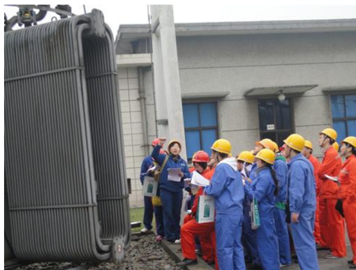
图十：安全规程知识现场培训

运行值班员岗位准入资格”(41人)、“特种作业人员操作证”(711人)、“内训师岗位能力”(79人)、“金牌班组长”(二期268人)、“进网电工作业许可证”(129人)、“物资采购招标、评标人员培训”(136人)、“非电行业配电运行岗位知识与技能培训”(29人)、“机电运行、变电运行、抄核收基础知识”(45人)、“机电运行知识与技能”(二期66人)、“水厂生产一线技能培训”(33人)、“安全生产知识”(320人)等岗位资格和技能培训；组织部分管理人员、专业技术人员和技能人员送外分别参加省公司和相关培训机构组织的“上市公司高管培训”“人力资源管理及组织发展”、“行政管理技能”等送外培训。2012年，共计组织内训和送外培训125期(次)，培训各类人员3922人次，全员培训率80.38%。