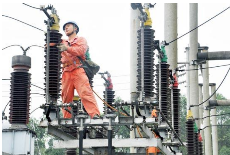
图一：开展检修确保安全供应

任分解落实到每个岗位、每名员工，进一步明确了各部门、单位的安全工作范围、重点、职责和目标任务，各单位员工安全责任书签订率实现 100%。建立反“三违”工作机制，切实加强反“三违”查处力度。坚持每月在总经理办公例会上进行月度安全生产分析评价，总结上月安全工作，安排布置本月安全工作，在公司上下基本形成齐抓共管的安全生产管理网络。