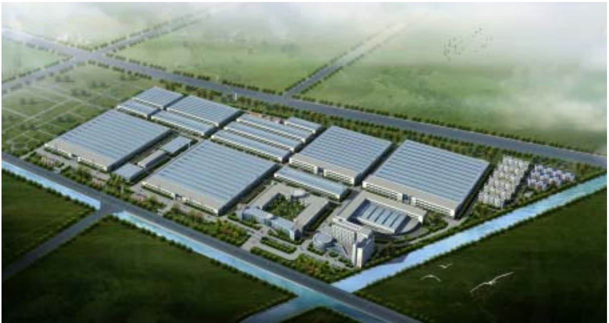
公司新厂区效果图