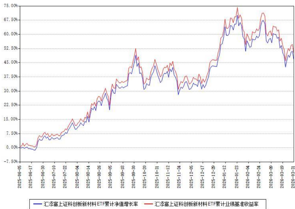
汇添富上证科创板新材料ETF累计净值增长率与同期业绩基准收益率对比图