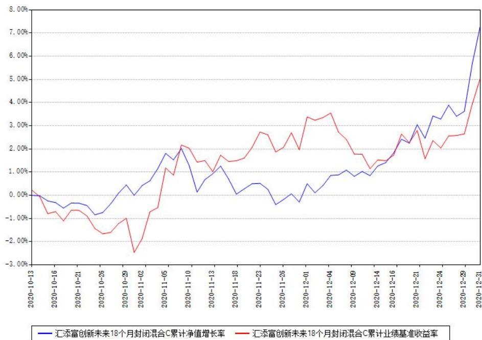
汇添富创新未来18个月封闭混合C累计净值增长率与同期业绩基准收益率对比图