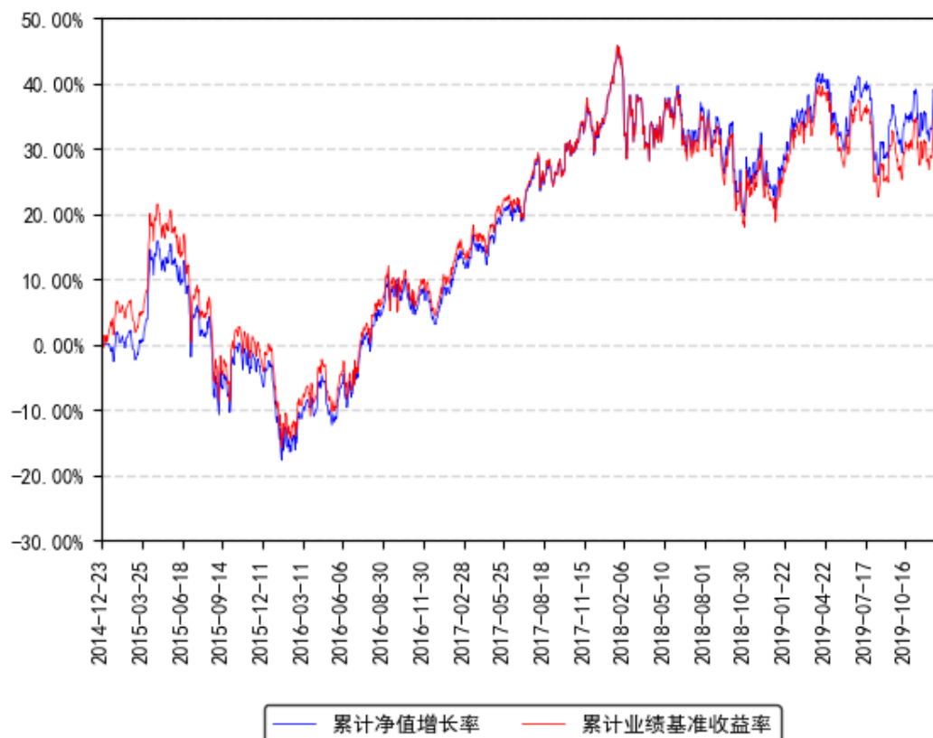
南方恒生ETF累计净值增长率与同期业绩比较基准收益率的历史走势对比图