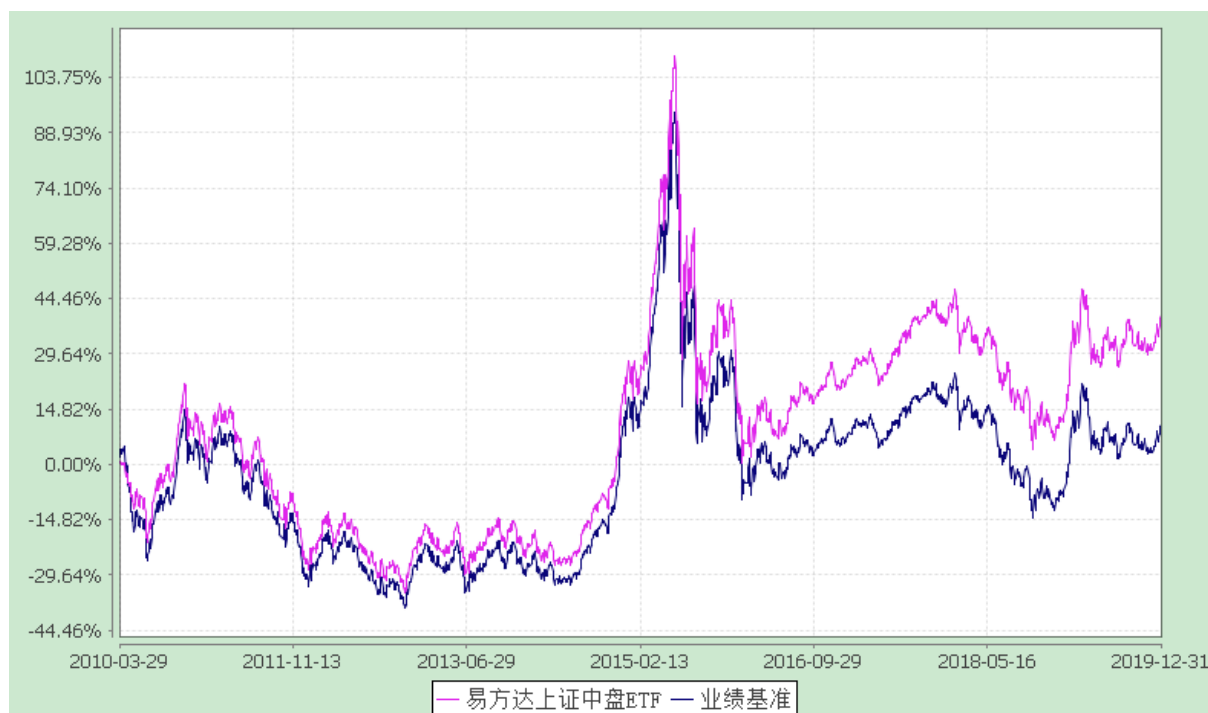
易方达上证中盘交易型开放式指数证券投资基金 份额累计净值增长率与业绩比较基准收益率历史走势对比图 (2010年3月29日至2019年12月31日)

注：自基金合同生效至报告期末，基金份额净值增长率为 40.03%，同期业绩比较基准收益率为 10.66%。