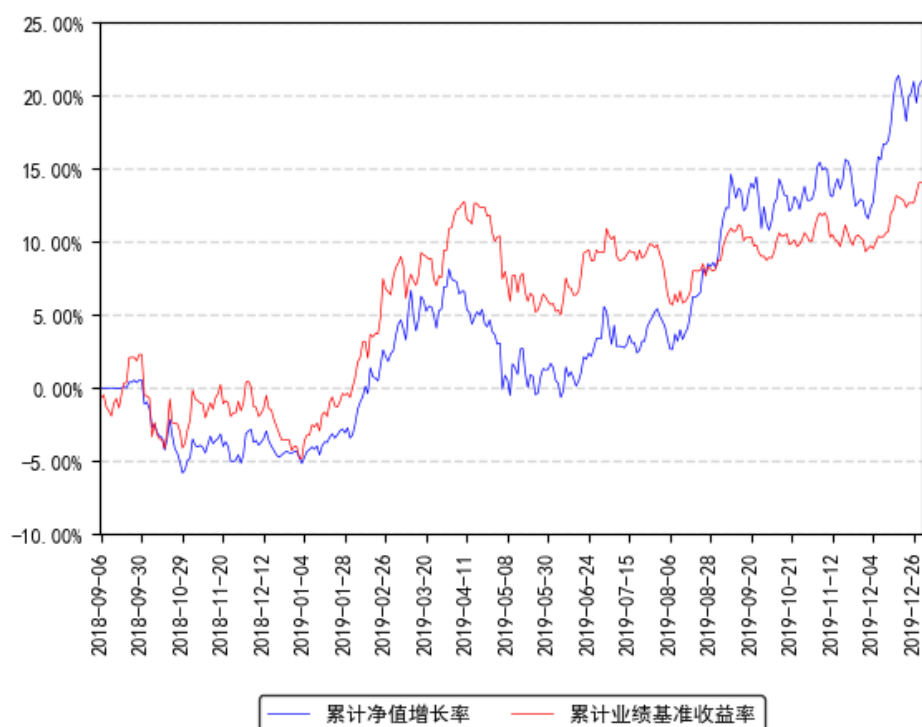
南方瑞合三年定期开放混合累计净值增长率与同期业绩比较基准收益率的历史走势对比图