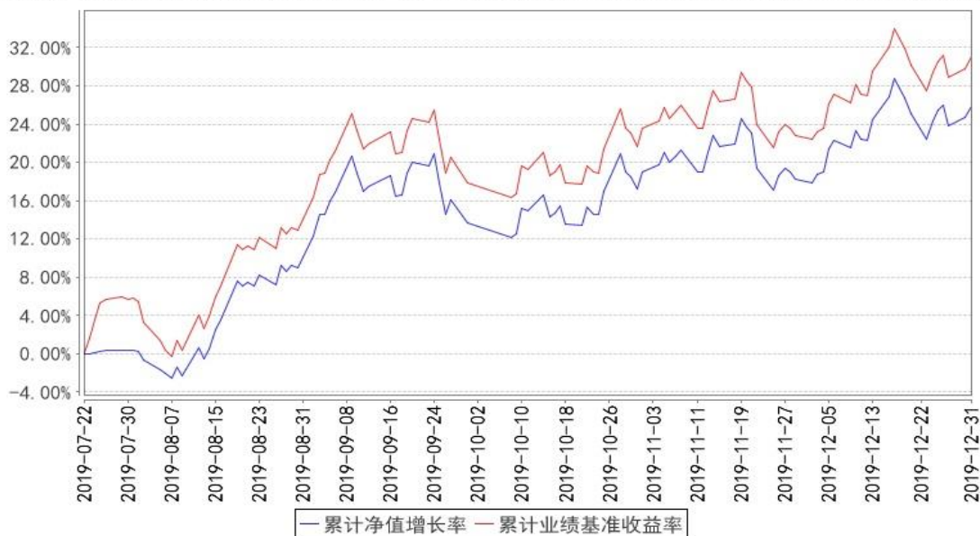
华宝中证科技龙头ETF累计净值增长率与同期业绩比较基准收益率的历史走势对比图

注：1、本基金基金合同生效于2019年7月22日，截至报告日，本基金基金合同生效未满一年。 2、截至2019年12月31日，本基金尚处于建仓期。