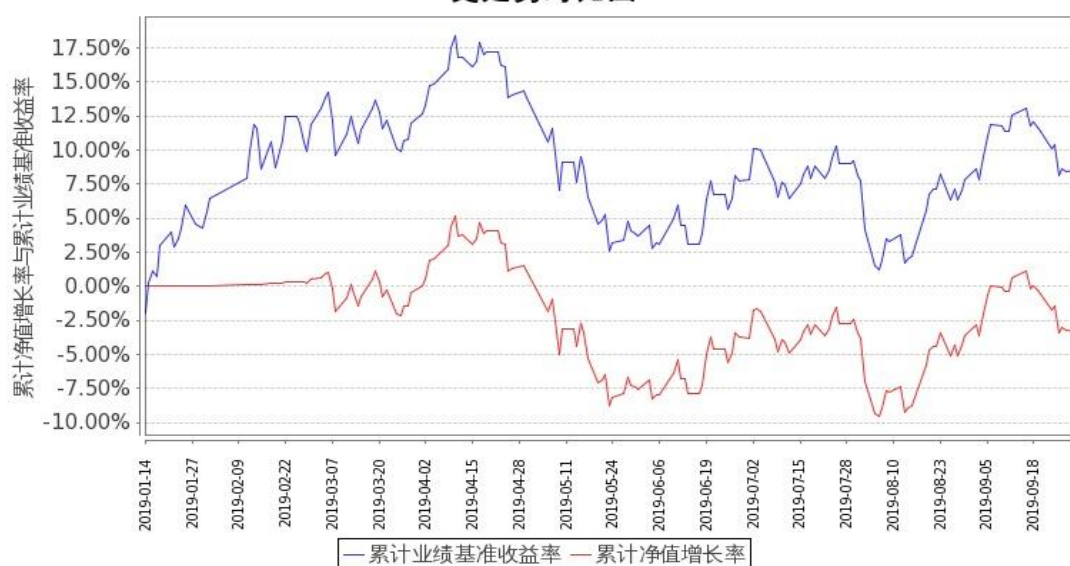
图 2: 嘉实港股通新经济指数(LOF)C 基金份额累计净值增长率与同期业绩比较基准收益率的历史走势对比图