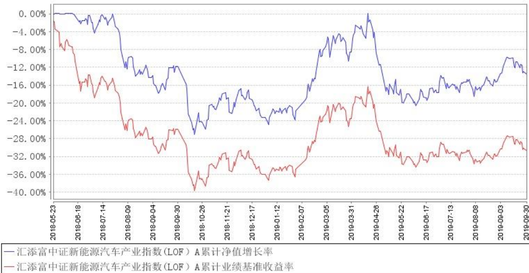
汇添富中证新能源汽车产业指数（LOF）A 累计净值增长率与同期业绩比较基准收益率的历史走势对比图