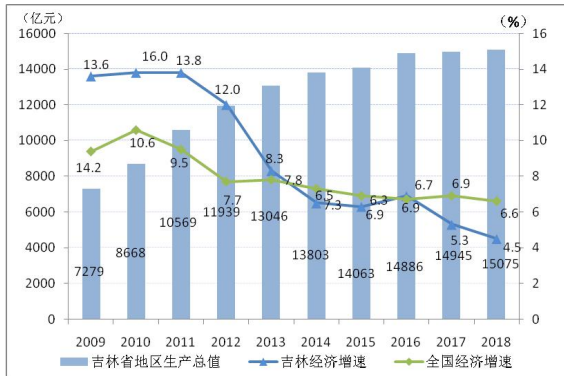
图 1 吉林省地区生产总值及增速情况

注：地区生产总值按当年价格计算；增速按不变价格计算