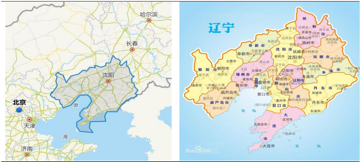
图表3 辽宁省区位图