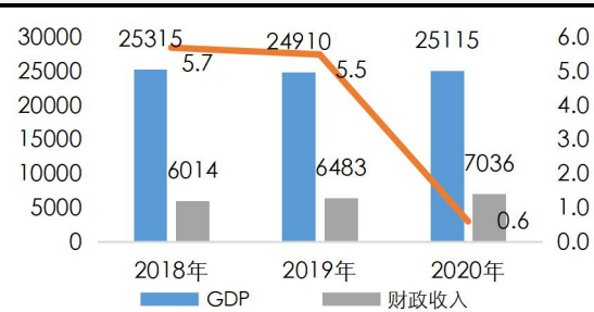
辽宁省经济财政指标 (亿元、%)